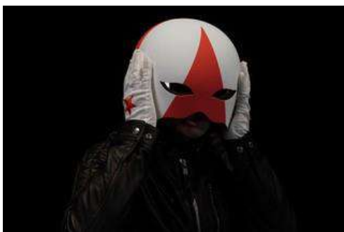
Cascadeur © Thomas Gurigen