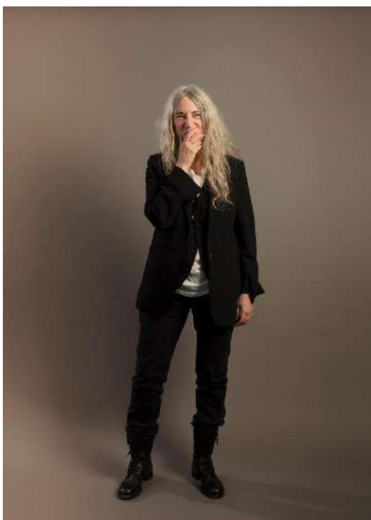
Patti Smith