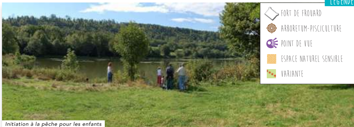
Initiation à la pêche pour les enfants