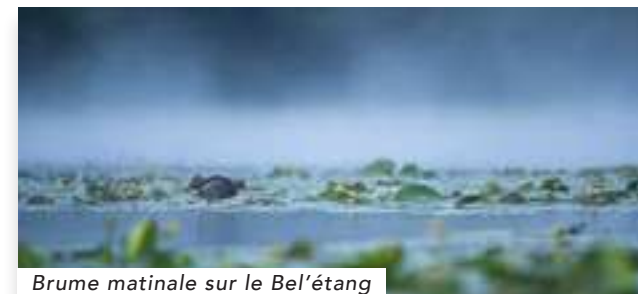
Brume matinale sur le Bel'étang