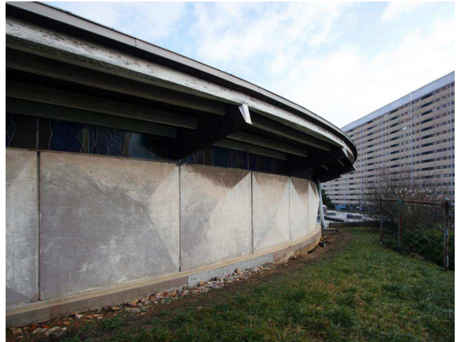
Cette construction, relativement basse, se distingue des constructions voisines qui s'imposent par leur linéarité et leur monumentalité.