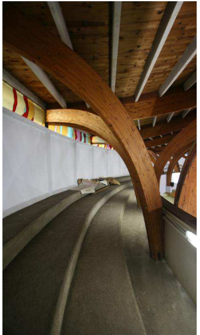
Les murs (vus ici depuis la tribune) sont réalisés à partir d'éléments préfabriqués en béton soutiennent une charpente en bois lamellé-collé.