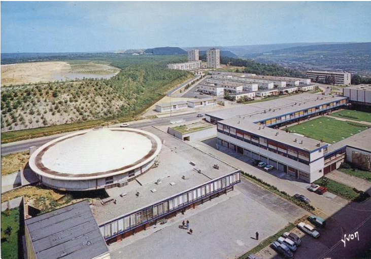
La courbe du dôme de l'église contraste avec l'orthogonalité des bâtiments alentours.