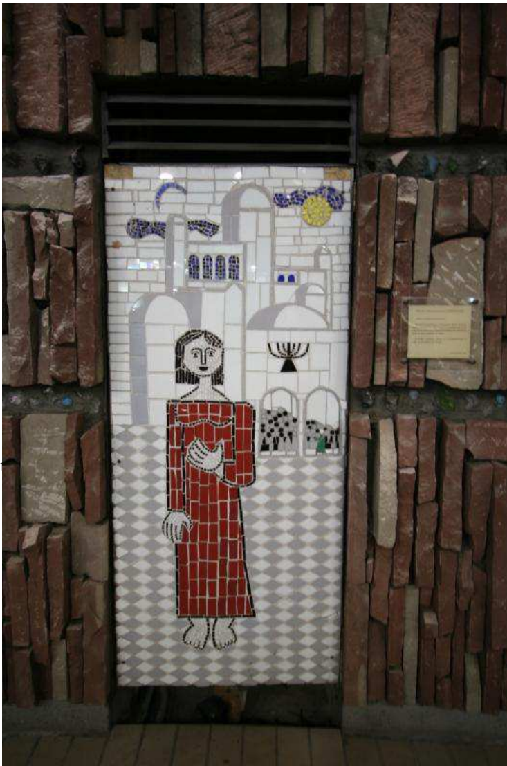
Cette mosaïque réalisée par Elisabeth et Francis Poydenot d'Oro représente la troisième des " Sept Douleurs de la Vierge Marie ".