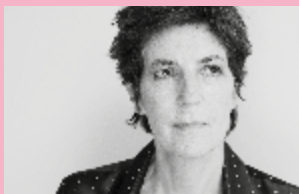
Christine Angot