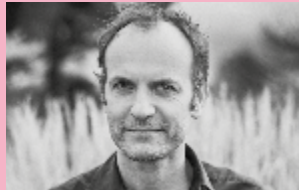
Timothée de Fombelle