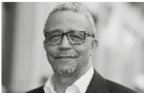
Yasmina Khadra