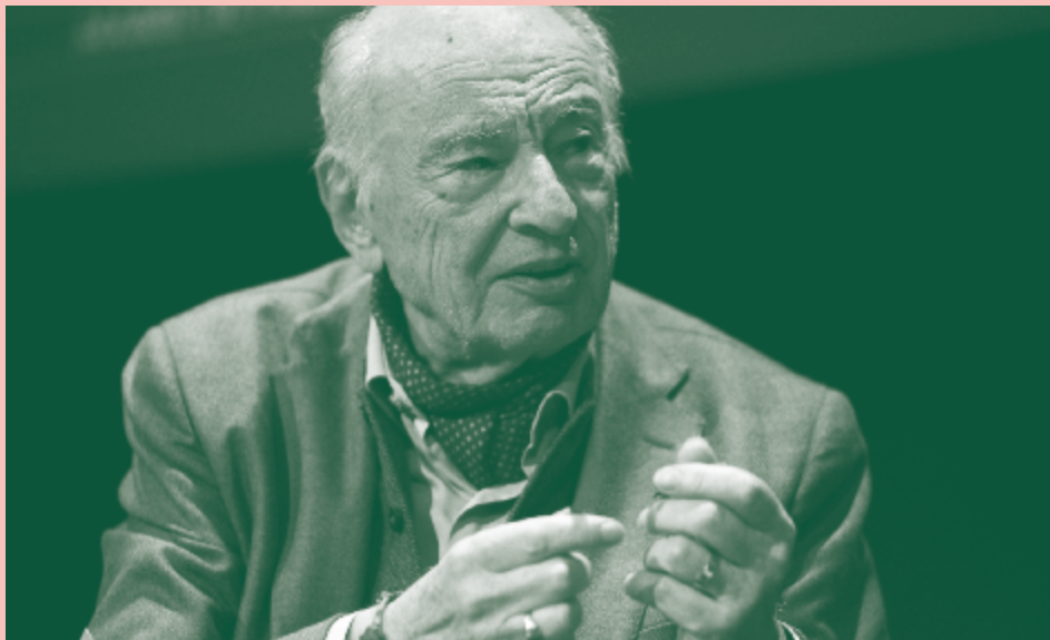
Edgar Morin