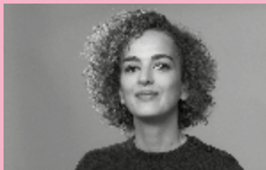
Leïla Slimani

En partenariat avec l'association Lire pour en Sortir