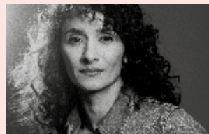
Rachida Brakni

En partenariat avec L'Est Républicain et l'Institut des Sourds de la Malgrange