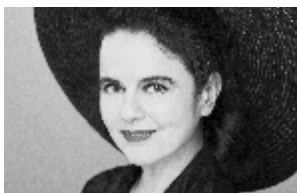
Amélie Nothomb

Amélie Nothomb revient avec un roman personnel qui trace encore plus les contours de ce qui la définit. À l'occasion d'un retour au Japon après la mort de son père, elle renoue avec les stupeurs et tremblements du passé, avec dans ses bagages un livre, À rebours de Huysmans, et questionne à travers ce roman l'impossible retour au pays tant aimé. « Tout retour est impossible, l'amour le plus absolu n'en donne pas la clé. »