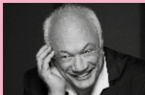
Eric-Emmanuel Schmitt