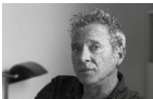
Caryl Férey