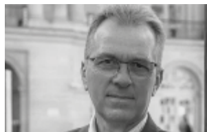
Jean-Marc Lemaître ©DR

En partenariat avec les Sciences sur la Place