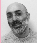
Eduardo Halfon