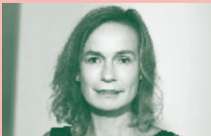
Sandrine Bonnaire