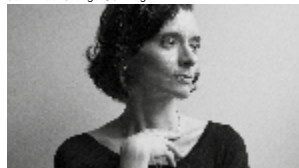
Clémence Boulouque