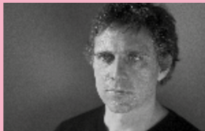
Aurélien Bellanger