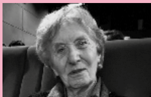
Michelle Perrot