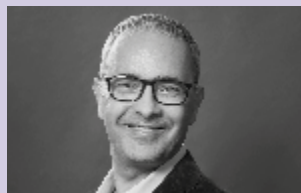
Kamel Daoud

En partenariat avec Le Point, la Fondation Jan Michalski et l'Institut des Sourds de la Malgrange