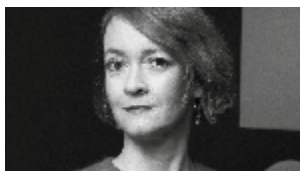
Marie Vingtras