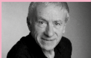
Jean-Christophe Rufin