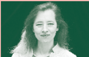
Isild Le Besco