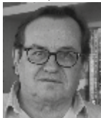
Yves Harté