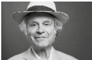
Franz-Olivier Giesbert