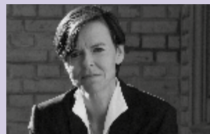
Antje Rávik Strubel

En partenariat avec le Goethe-Institut Nancy et la Fondation Jan Michalski