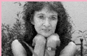
Nancy Huston