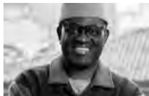
Alain Mabanckou