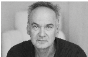
Hervé Le Tellier

En partenariat avec l'Institut des Sourds de la Malgrange