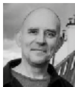
Christian Durieux