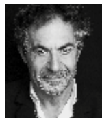
Etienne Klein