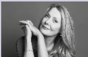
Anna Funder

En partenariat avec la Fondation Jan Michalski