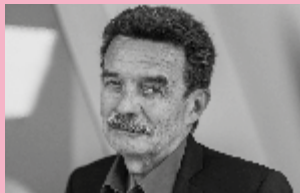
Edwy Plenel