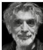
Edmond Baudoin