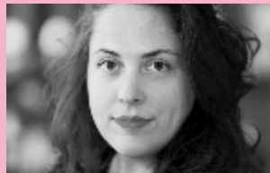
Louison ©Alain Bujak