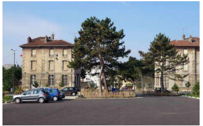
Les anciens bureaux de la direction et la maison d'octroi encadrent l'entrée du site.