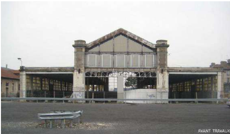
Cette photo de la halle avant travaux permet d'apprécier d'autant mieux la qualité de la requalification.