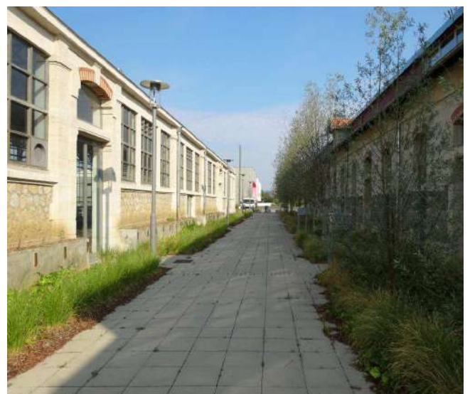
Une allée plantée fait transition entre la halle d'expérimentation et les bureaux de SCALÉN.