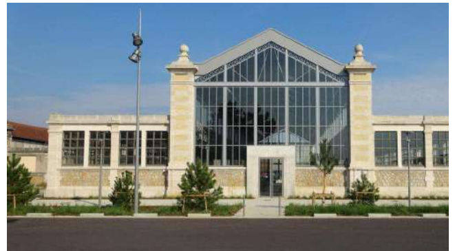
Les menuiseries extérieures et le ravalement des façades ont permis de redonner à la halle d'origine.