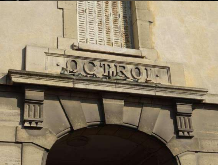
Ce détail de la maison d'octroi témoigne une nouvelle fois du soin apporté à l'architecture utilitaire ancienne.