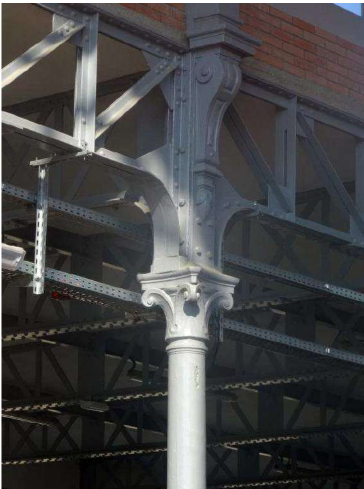
Les poteaux en fonte ont été restaurés. Leurs chapiteaux classiques associés au métal riveté sont typiques de l'architecture utilitaire héritée du XIXe siècle.