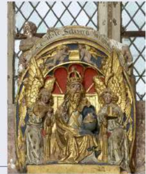
Fig. 31 Lorraine, Monument funéraire du duc René II (détail du Père Éternel sur son trône), 1508-1509.