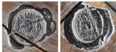
Fig. 191 et 192 Sceaux des commissaires de France et d'Autriche posés sur les cercueils des cendres des ducs de Lorraine, 1826.

La cérémonie se déroula en plusieurs étapes 2 . Le mercredi 8 novembre, à 9h, les sceaux posés sur les grilles d'une des chapelles de la cathédrale par les commissaires de France et d'Autriche, à savoir le marquis de Foresta, préfet de la Meurthe, et le baron de Vincent, ancien ambassadeur d'Autriche, furent brisés (fig. 191 et 192) et les cercueils en sortirent pour gagner une chapelle ardente 3 du côté droit du chœur de la cathédrale, afin d'être exposés pendant 24 heures à la « vénération du public » 4 .