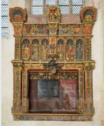
Fig. 30 Lorraine, Monument funéraire du duc René II, 1508-1509.