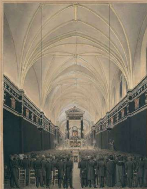
Fig. 190 D. Faivre. La cérémonie expiatoire du 1826, 1826. Vienna, Bibliothèque nationale.