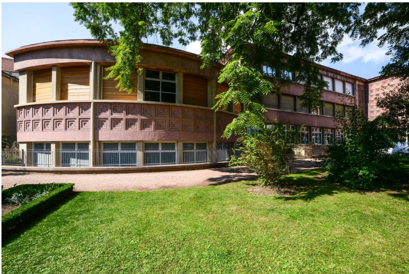
Muséum-Aquarium de Nancy

Zoologie et son institut - L'actuel Muséum Aquarium de Nancy, conçu par les frères Jacques et Michel André. Pour sa construction, ils choisirent un style et un procédé de construction avant-gardiste conçu par Frank Lloyd Wright, avec qui ils ont correspondu.