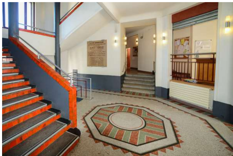
Cité U Monbois

Université - C'est à cette époque que furent créés de nombreux bâtiments universitaires, parmi lesquels le foyer étudiant du GEC (1926 à 1931), l'institut de formation aux soins infirmiers (1930), la faculté de pharmacie (conçue dans les années 1930 mais achevée en 1951), la cité universitaire Monbois (1932), la bibliothèque de la faculté de droit (1932 à 1939) ; la faculté de chirurgie dentaire (1932), la bibliothèque de l'ancienne faculté de pharmacie (1934).