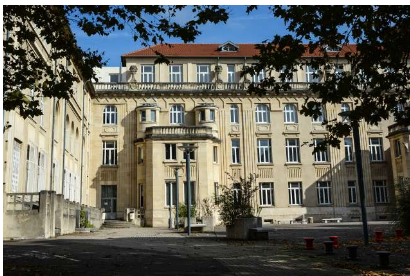
Lycée Paul Louis Cyfflé