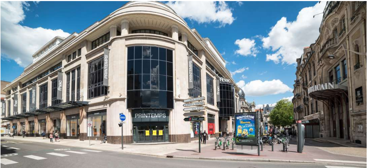
Anciens Magasins Réunis

Magasins Réunis – L'un des bâtiments Art déco les plus emblématiques de la ville de Nancy, aujourd'hui sous l'enseigne Printemps-Fnac. A l'origine de style Art nouveau, il est reconstruit après l'incendie de 1916 selon les souhaits de son directeur Eugène Corbin, qui confie sa réalisation à l'architecte Pierre Le Bourgeois. Inauguré en 1928, ses frises en corniche et ses bas-reliefs en façade sont typiquement Art déco.