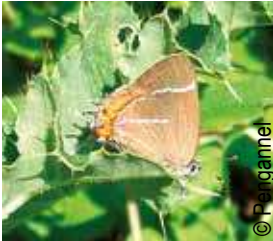
Thécla de l'orme