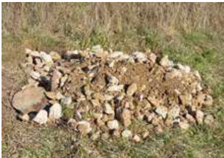
Pierrier en construction