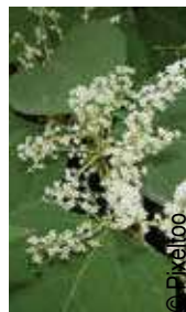
Régulation de plantes invasives (buddleja, robiniers, renoué du Japon ...)