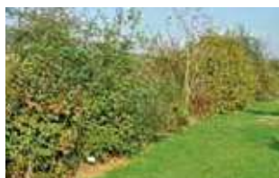
Plantation de haie à fleurs et à baies fournissant nourriture et refuge à la faune