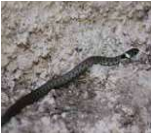
Couleuvre à collier