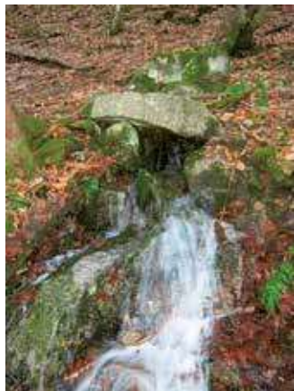
Source de la Meurthe