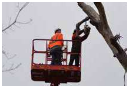
Sécurisation des chemins (suppression branches mortes...)

Tout en respectant au maximum la tranquillité des habitats présents sur ce site, quelques travaux ont été nécessaires afin d'assurer la sécurité des visiteurs, d'améliorer les conditions de vie d'espèces existantes et de favoriser l'accueil de nouvelles. Par exemple :