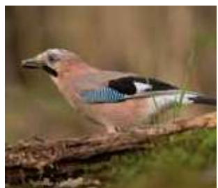
Geai des chênes