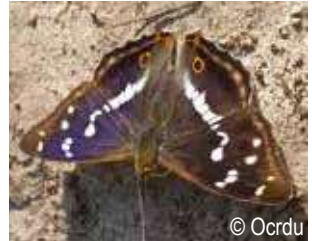
Grand mars changeant