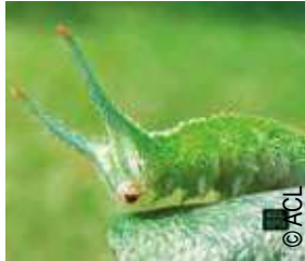
Chenille grand mars changeant