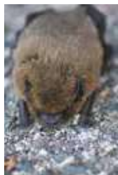
Taille des saules en têtard permettant l'accueil d'espèces telles, hérisson, chauve-souris, pic épeiche ...