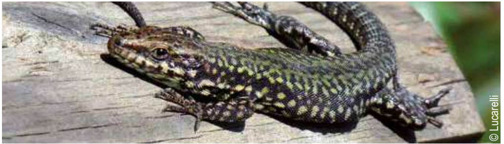
Lézard des murailles