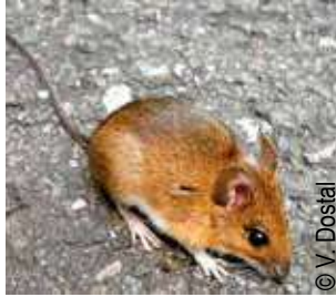
Mulot à collier