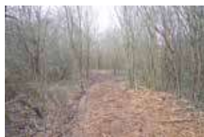
Création d'un chemin et ouverture de clairières de façon à canaliser le public et à favoriser le maintien ou l'apparition de certaines espèces