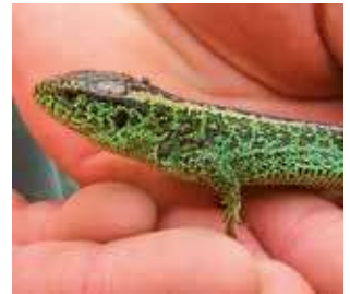
Lézard des souches