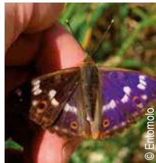
Petit mars changeant

*Zone Naturelle d'Intérêt Ecologique Faunistique et Floristique