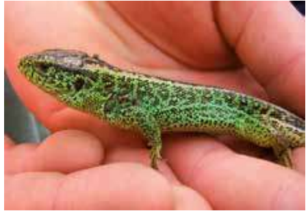
Lézard des souches